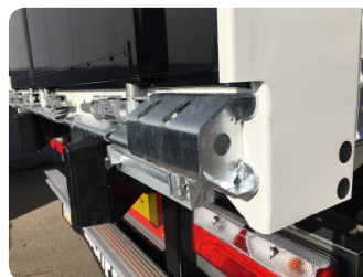
Angolari di protezione