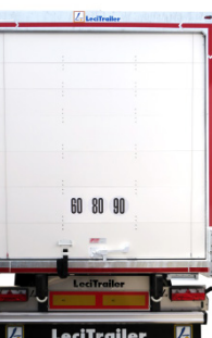
Porta a serranda