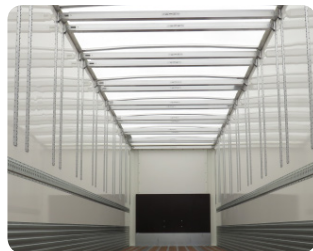
Opzione doppio piano e tetto in poliestere.