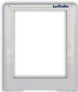
Parete anteriore: struttura monoblocco galvanizzata e in cataforesi KTL