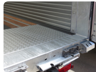
Lamiera di protezione per accesso carrelli