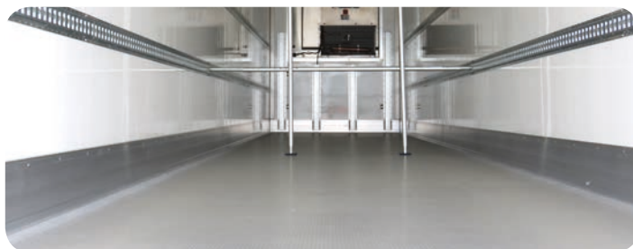
Pianale in alluminio, zoccolo in alluminio e rail fermacarico