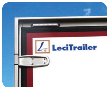
Portale in acciaio Inox e luci di ingombro sequenziali 3 posizioni