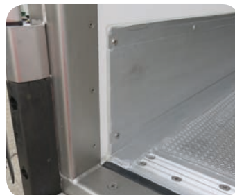
Gomma rottura ponte termico e profilo in alluminio transizione a pianale