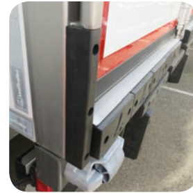
Tampone laterale verticale e tamponi coperti in lastra