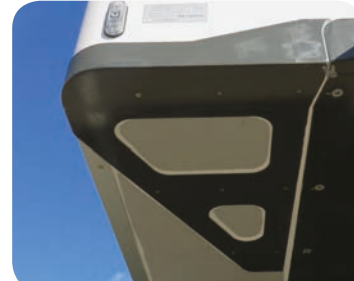
Opzione rinforzo angolare anteriore per nave